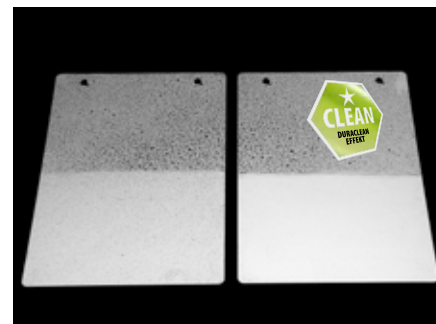
Ułatwiony proces mycia